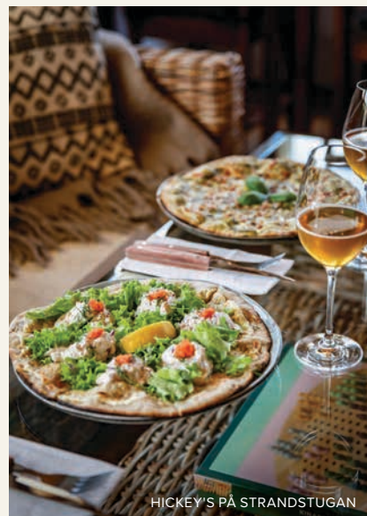
HICKEY'S PÅ STRANDSTUGAN

Från Falkenbergs södra områden så kommer här därför några livsviktiga stopp för att din vanliga roadtrip ska bli tidernas roadtrip.