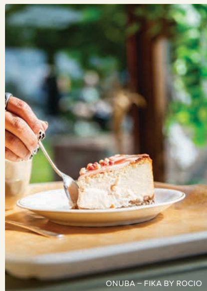
ONUBA – FIKA BY ROCIO