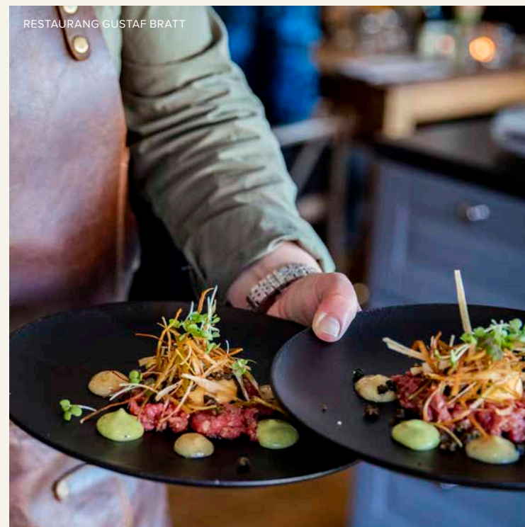
RESTAURANG GUSTAF BRATT