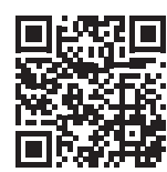
Paddla / Canoeing / Paddeln