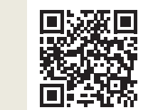
Vandra / Hiking / Wandern