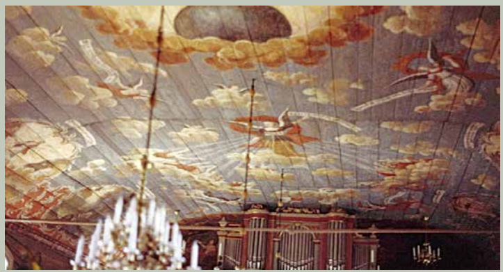
Paddla / Canoeing / Paddeln

Rund um den See Fegen gibt es eine lebendige Kulturlandschaft, in der Geschichte und Kunst aufeinandertreffen. Besuchen Sie die Gammalsjö-Mühle, wo die Geschichte der lokalen Mühlen weiterlebt, oder Klockaregården in Häcksvik mit ihren Wandmalereien aus dem 19. Jahrhundert. Hier befinden sich auch das Ekomuseum Nedre Åtradsalen und "Morfars Glänta" in Åtran, ein Kunstprojekt in der Natur. Lesen Sie mehr unter www.fegenoutdoor.se .